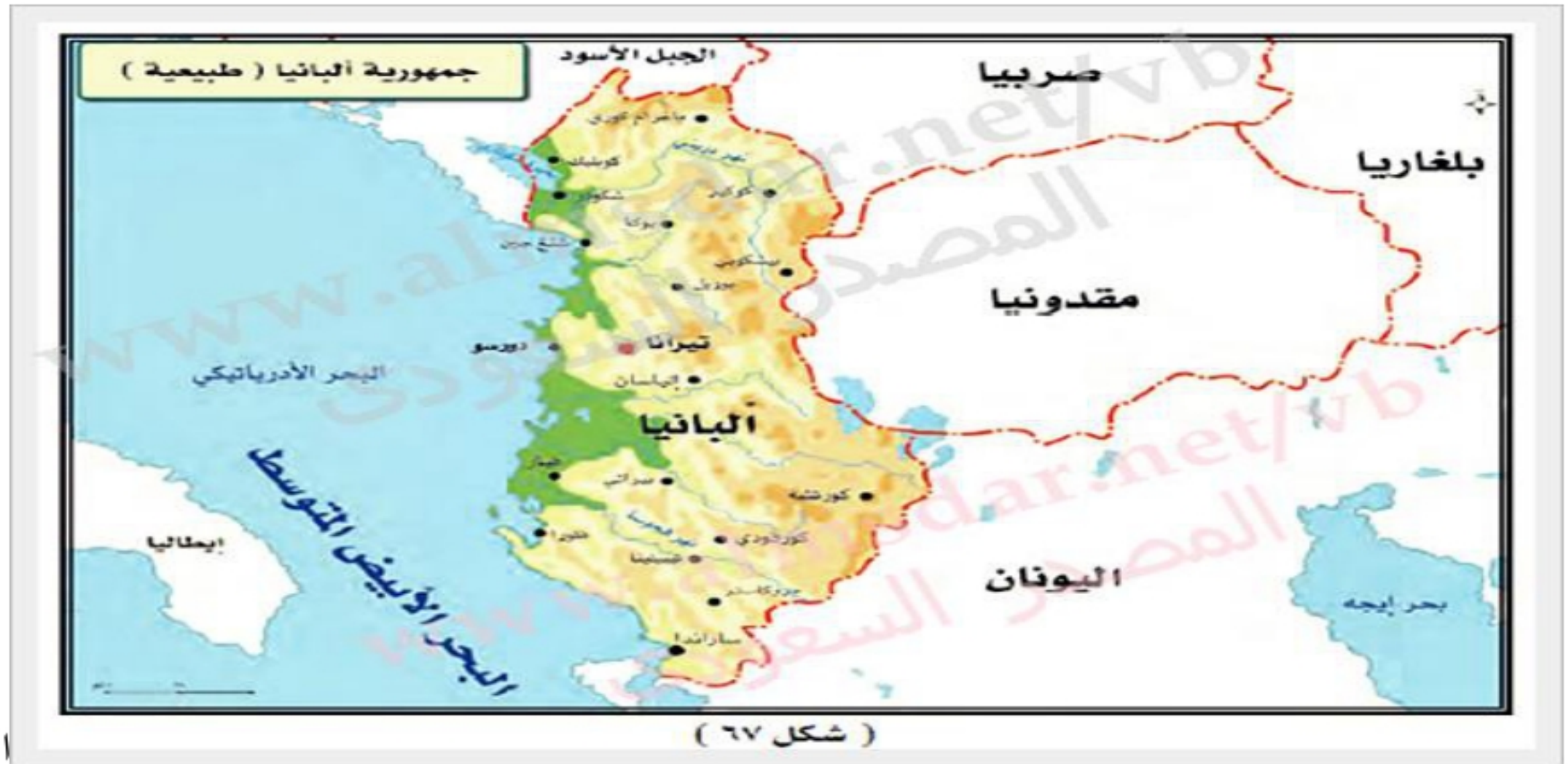
( شكل ٦٧ )

ب/امامك خارطة لجمهورية البنيا الإسلامية تأملى الخارطة واجيبى عن التالى؟